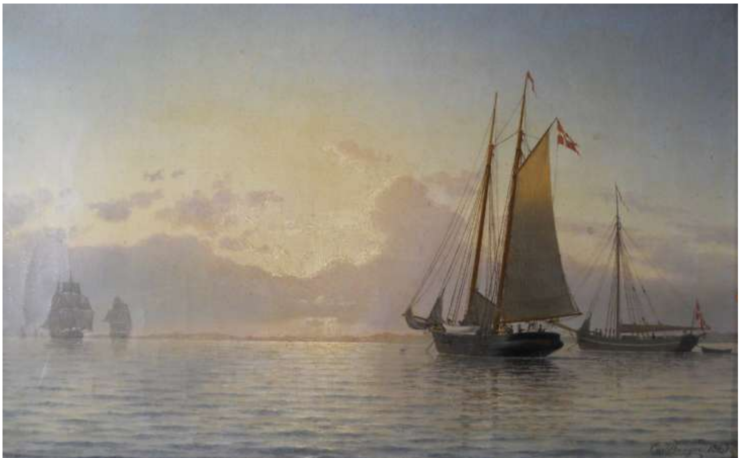
Krydstoldskonnerten ARGUS for anker i Odense Fjord. Maleri fra 1863 af Carl Baagøe.

Og så var der skibsbyggeren, der altid lagde sit øl på køl.